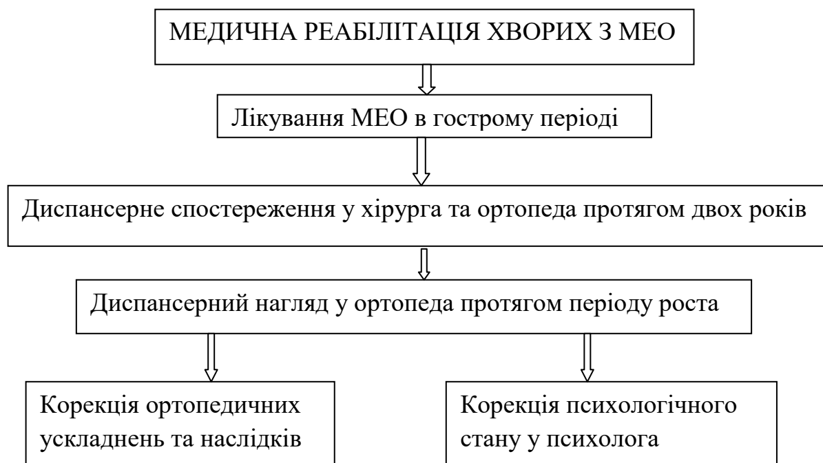
Рис. 2. Схема медичної реабілітації хворих МЕО.

Виходячи з вище вказаного, обґрунтованими є наступні етапи реабілітації у дітей з МЕО (рис. 2): лікування МЕО в гострому періоді та диспансерне спостереження у хірурга та ортопеда протягом 2-х років (абілітація); відновлення структури і функцій ураженого сегменту кінцівки протягом росту пацієнта (диспансерне спостереження і корекція у ортопеда); корекція наслідків перенесеного МЕО, котра внаслідок тяжких вад пов'язана здебільшого з корекцією психологічного стану, що дозволить адаптуватися хворим в суспільстві (протягом життя у ортопеда та психолога).