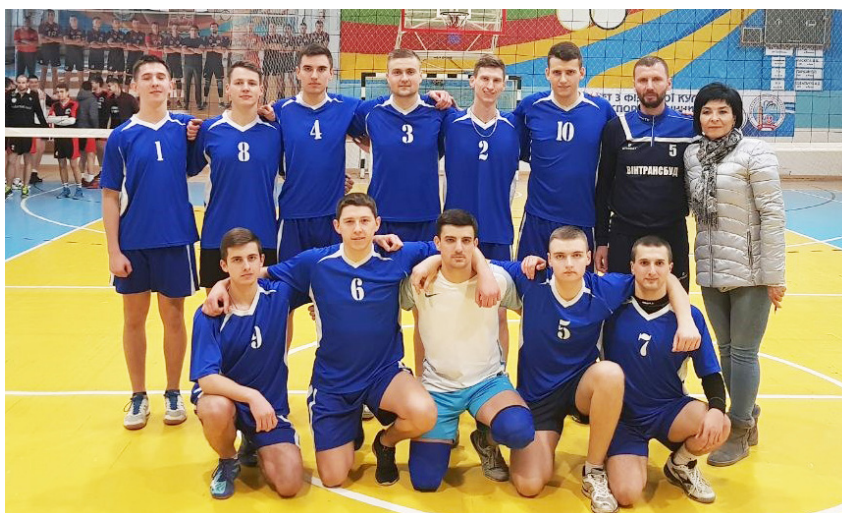
Чоловіча збірна ВНМУ з волейболу