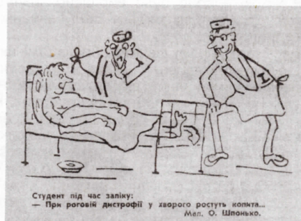
Студент під час заліку: — При роговій дистрофії у хворого ростуть копита... Мел. О. Шпонько.

В. Шпонько, слухач військово-медичного факультету КМІ.