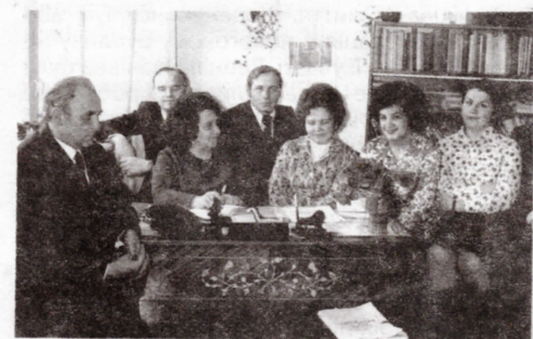
Коллектив кафедры факультетської терапії сімдесятих років