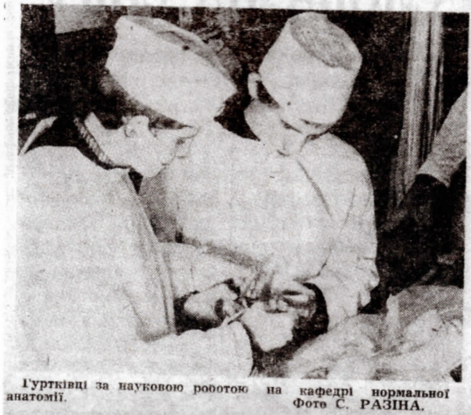
Гуртківці за науковою роботою на кафедрі нормальної анатомії.